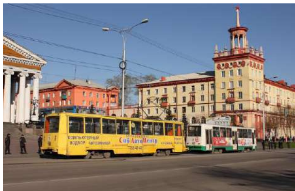
Фото № 22. Визуальные средства