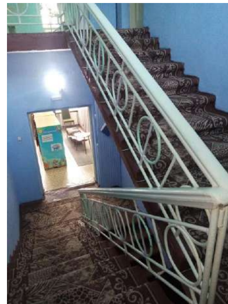
Фото № 13. Лестница (внутри здания)