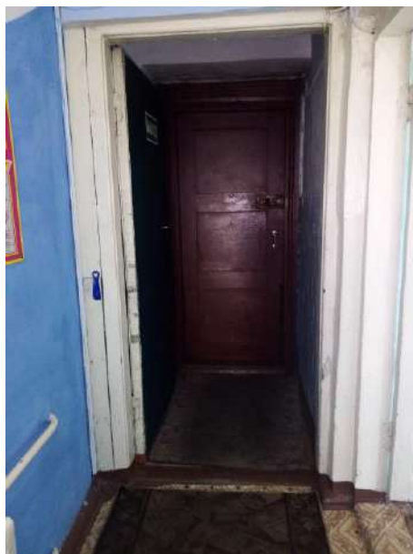
Фото № 10. Тамбур 2