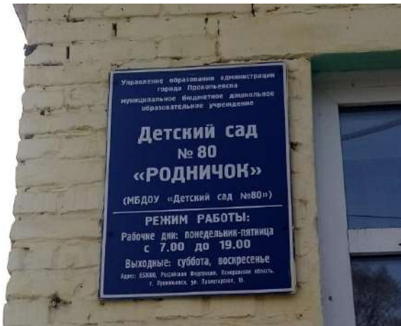
Фото № 20. Визуальные средства