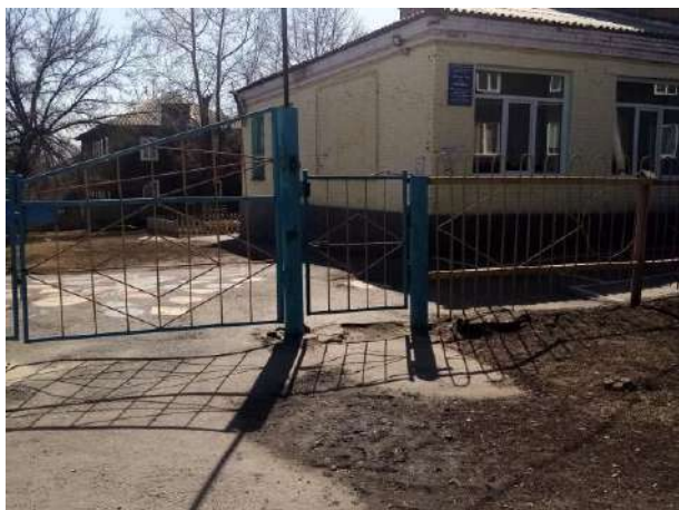
Фото №1. Вход на территорию