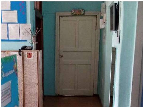
Фото № 14. Дверь