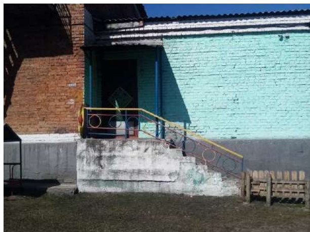
Фото № 3. Лестница (наружная)