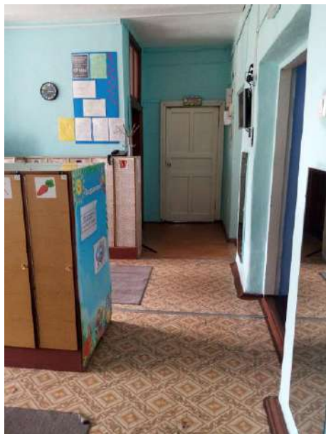
Фото № 12. Коридор