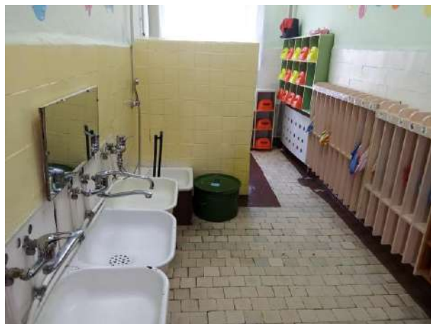
Фото № 18. Туалетная комната