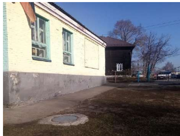
Фото 2. Пути движения по территории