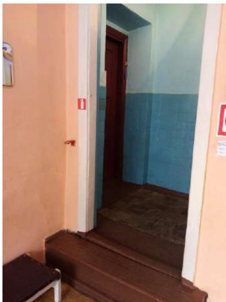
Фото № 9. Тамбур 1