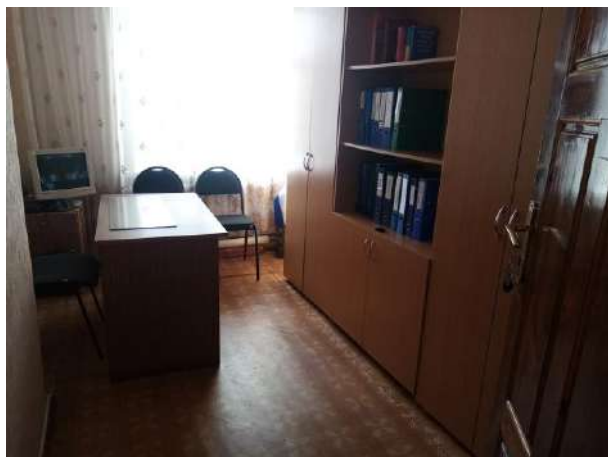
Фото № 16. Кабинетная форма обслуживания